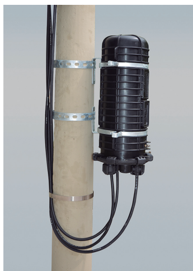
Poste ou Parede