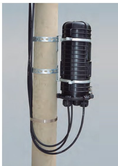
Poste o Pared