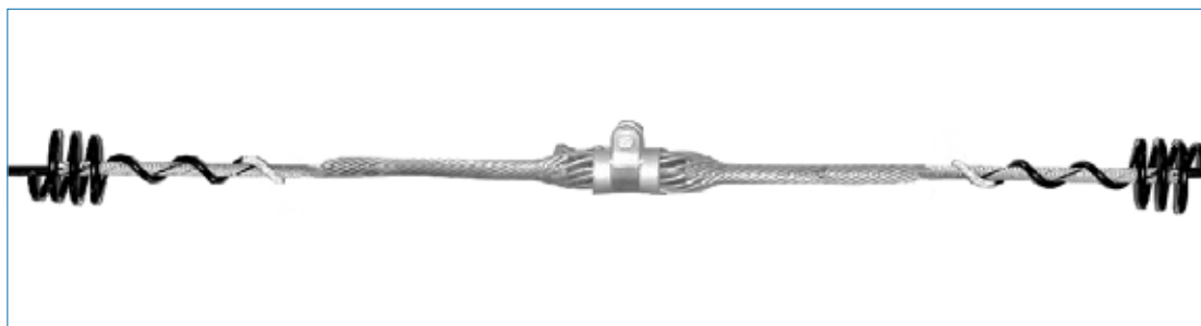
Corona Coil aplicado no Grampo de Suspensão Fiberlign - AGSO

O Corona Coil é instalado sobre as extremidades das varetas de proteção do Grampo de Ancoragem Fiberlign (FDDE), ou do Grampo de Suspensão Fiberlign (AGSO).