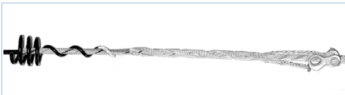
Corona Coil aplicado no Conjunto de Ancoragem Fiberlign - FDDE